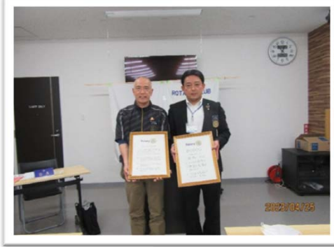
米永会長 入会承認